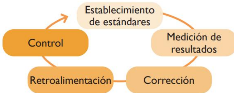
Figura 34. Clasificación de las etapas del control.