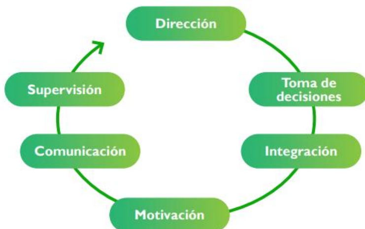
Figura 32. Clasificación de las etapas de la dirección.